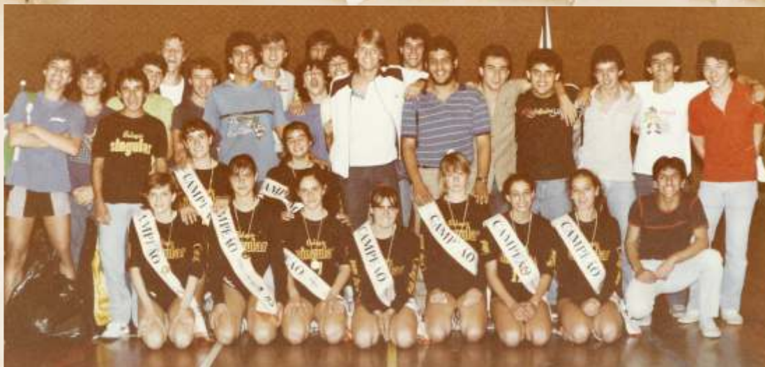
1985 - Alunos da unidade Alvaro de Azevedo