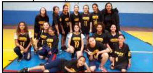
Equipe mirim feminina de basquete

Na primeira semana de disputas, as equipes de Handebol, com os times do Singular Júnior e Liceu Monteiro Lobato venceram seis jogos. Já na categoria de Basquete, pré-mirim, mirim e infantil, garantiram três vitórias. Com isso, a rede dispara na competição, da qual é a atual campeã dos Jogos Escolares da cidade.